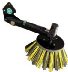
Hydraulic side brush set, mixed (poly/steel) with 550mm diameter.

Conjunto cepillo lateral hidráulico, mixto (plp/acero) de 550mm de diámetro.