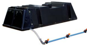
Water system with 125l water tank, 12v pump and sprinklers.

Sistema de riego con depósito de 125lts, bomba de 12V. y lanza con aspersores.