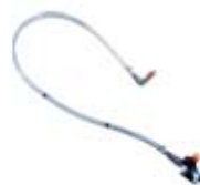
Water system derivation kit for side brush.

Kit derivación riego para cepillo lateral.